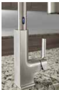
Indicateur de piles faibles